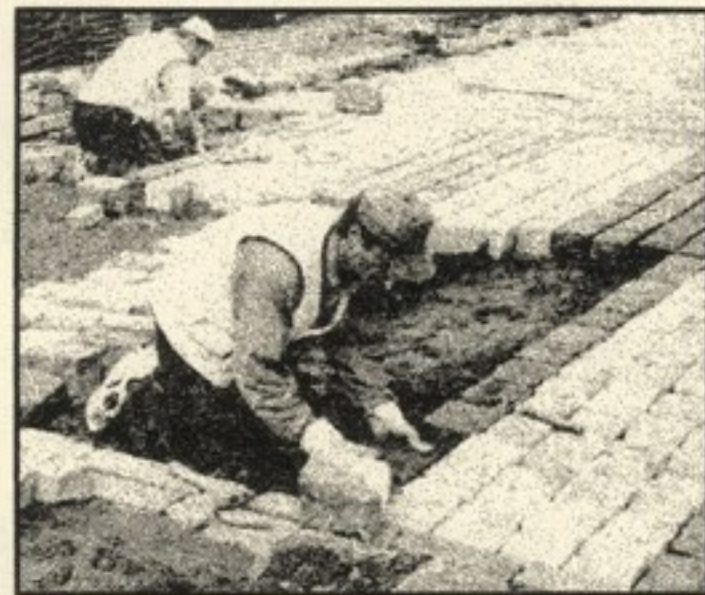
Zetorin kestävä nupulakiveä.

Rakennusviraston katukivi-yksikön erikoistutkijat päätyivät pitkällisten tutkimusten jälkeen siihen lopputulokseen, että vauriot oli aiheuttanut poik-keuksellisen vahvavääntöisten traktoreiden lauma. Lopullinen vastaus löytyi sitten Helsingin Sanomien julkaisemasta artik-kelista ja sen perusteella saatujen silminnäkijälauseun-tojen pohjalta. Vaurioituneet kadun pätkät vastasivat Temmeksen miesten lokakuusel-la vierailullaan ajamaa reittiä! Miehillä oli ollut allaan Zetorit, traktorimaailman 'el ninjot', ja niillä he aiheuttivat, toki täysin tahattomasti, suuremmentin Helsingin kaduille.